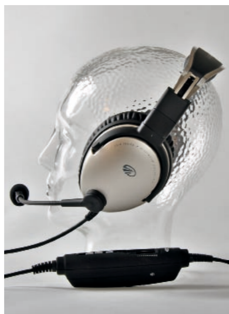
Bester im Test: Das Lightspeed Zulu mit der Note 1,3 kostet 795 Euro. So schräg wie im Foto sollte man es nicht tragen