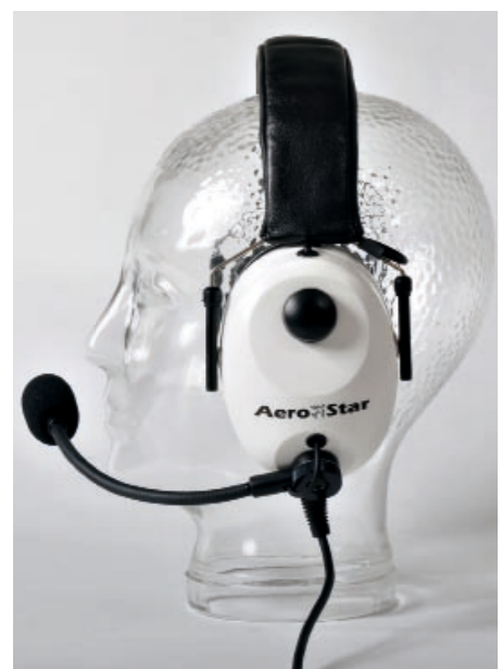
Preis-Leistungs-Sieger: Das passive Aero-Star -comfort- kostet 129 Euro und erreichte eine Gesamtnote von 2,4

»Überflüssiger Schnickschnack« sagen die einen, »muss ich haben« die anderen: Wenn es um Stereotauglichkeit, Musikwiedergabe sowie Musik- und Handy-Eingänge geht, dann ist der Streit im Vereinsheim schnell angezettelt. Doch ein Blick auf die ausgewählten Modelle zeigt: Der Markt hat entschieden. Ein zeitgemäßes Headset ist heute zwischen Mono und Stereo umschaltbar und verfügt zumindest als ANR-Modell über Anschlussmöglichkeiten für einen Musikplayer und ein Mobiltelefon